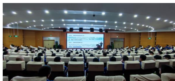
图 3.1 吴兴区企业百万员工安全大培训