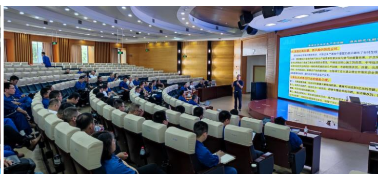
图 3.3 安全生产法培训

为牢固树立全体员工的诚信意识，公司每年年初制定本年度的教育培训计划。实行三级教育培训。由公司组织安排教育工作，各部门负责人根据公司要求，编制教育培训计划和内容，认真组织下属的教育培训。各车间主任负责班组长及员工的诚信宣传教