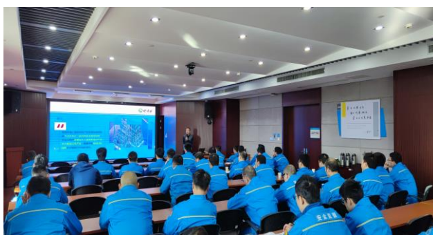
图 3.2 质量管理体系标准培训